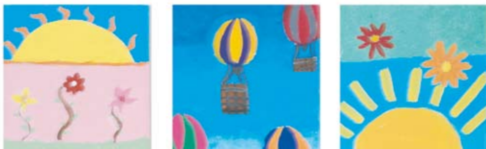
Frohe Weifnachten und ein Glückliches Neues Jahr - Joyeux Noël et une Bonne Année